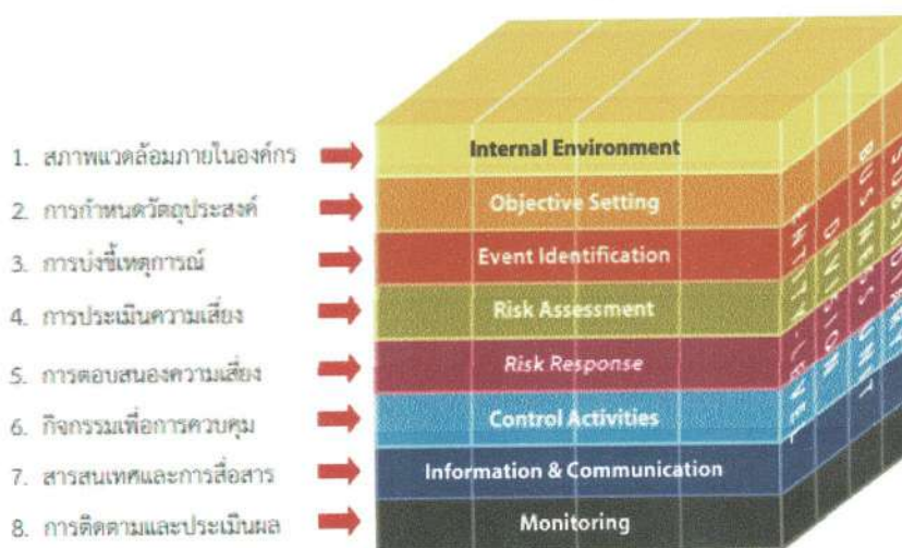
ประเภทของความเสี่ยง

กรอบการบริหารความเสี่ยงขององค์กรที่ได้รับการยอมรับว่าเป็นแนวทางในการส่งเสริมการบริหารความเสี่ยงและเป็นหลักปฏิบัติที่เป็นสากล คือกรอบการบริหารความเสี่ยงสำหรับองค์กรของคณะกรรมการ COSO (The Committee of Sponsoring Organization of the Treadway Commission) กรอบการบริหารความเสี่ยงสำหรับองค์กร (Enterprise Risk Management Framework) ดังกล่าวมีองค์ประกอบดังนี้